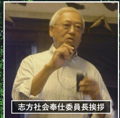
志方社会奉仕委員長挨拶