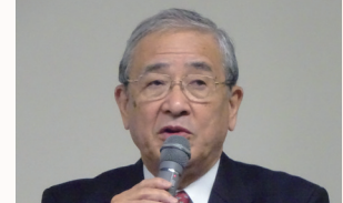
職業奉仕・職業倫理小委員会