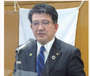
高砂市市長 都倉 達殊様