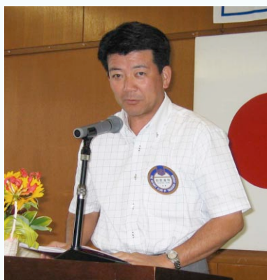
新世代委員会 都倉委員長