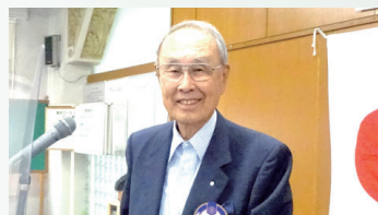
京谷慎平 ロータリー財団委員長