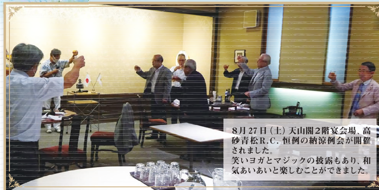
8月27日(土) 天山閣2階宴会場、高砂青松R.C. 恒例の納涼例会が開催されました。笑いヨガとマジックの披露もあり、和気あいあいと楽しむことができました。