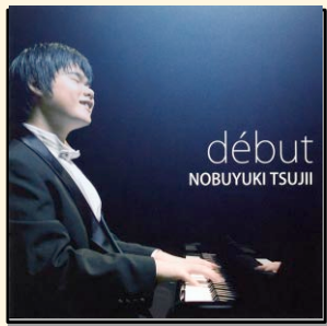
11月18日本日一枚 Début NOBUYUKI TSUJII

今日の一枚はメンバーの方よりリクエストがあった一枚をPart 1, Part 2と2週にわたりお届けします。