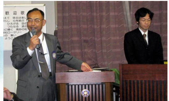
三菱三綱領(ロータリー精神と概ね一緒)

三菱重工高砂製作所が設計・製作している各種発電プラントのエンジニアリング全般にわたり支援しています。