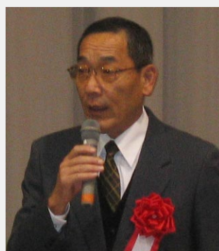
松陽高校 瀬戸川校長