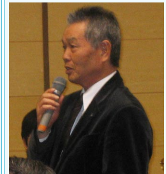
コメント高砂青松R.C. 小西会員