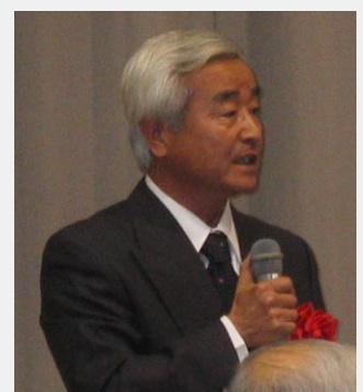
白陵高校 川副教頭