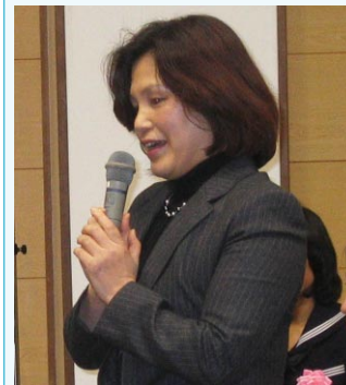
コメント 高砂R.C. 坂井会員