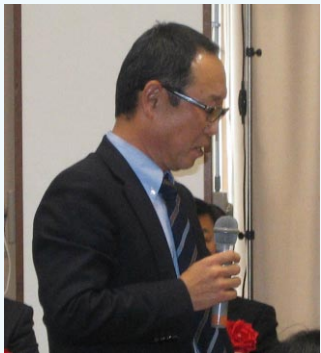
コメント 高砂R.C. 中野会員