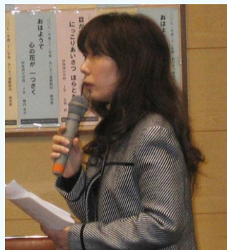
コメント高砂青松R.C. 青木会員