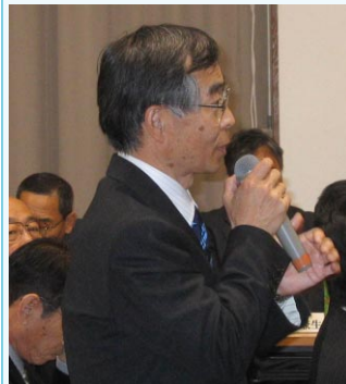
コメント 高砂R.C. 佐野会員