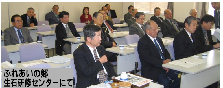
ふれあいの郷 生石研修センターにて

私は専門的なエキスパートではありませんし、優れた臨床力をもった医師でもありませんが、患者さんの立場にたった優しい良医でありたいと考えています。また自分の分をわきまえて治療を施し、また楽をしたいと誘惑に負けず正直・誠実に仕事し患者の信用を得るように努めていきたいと考えています。