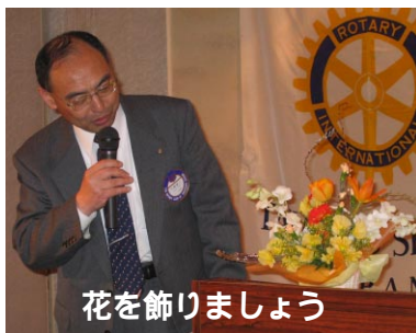
花を飾りましょう